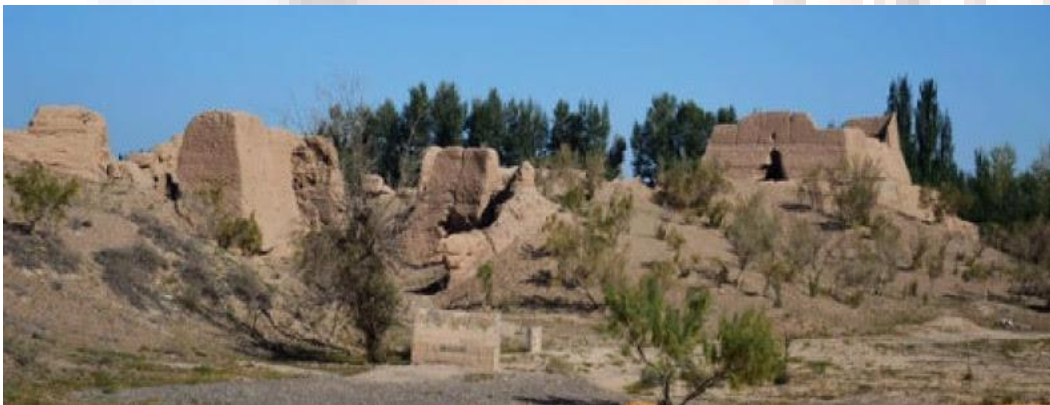
Qedimqi Qarasu Döliti Xarabisi (Xitayning haziqi Gensu ölkisining Zhangye Shehiri etrapida)

*Qarasu deryasi Ergüne köli ( 额济纳湖), Juyan köli ( 居延湖) qatarliq köllerdin èqip kèidighan kichik èqinlardin hasil bolup, tedriji ulghuyup yèraq sherqtiki Baltiq Dèngizigha qoyulidighan bir büyük derya. Bu Qarasu wadisida miladidin burun Hunlar yashaytti. Uningdin kèyin, bu rayonda yashighan xelqlerning nami 'Türk', 'Uyghur' dep atalghan. Arxèologar 1960-yillarda bu rayondin qedimqi 'Qarasu Döliti' ning xarabisini tapti we uning 'Qarasu Döliti' (黑水国) dègen namini eslige keltürdi, gerche bu edimqi elning ismi - ni Xitay tarixchiliri alliqachan '甘州回纥' (Genus Uyghurliri) dep özgertip atap kèliwatqan bolsimu. 1911-yilidin kèyin, Xitay milletchiliri bu Qarasu deryasining namini 'Sèriq Derya' ( 黄河) (sèiq tenliklerning ana deryasi) dep atıwalghan. Uningdin burun, bu deryaning ismi Xitayche tarixiy kitablarda '乌水' (Qarasu) dep yèzilip kelgen idi.