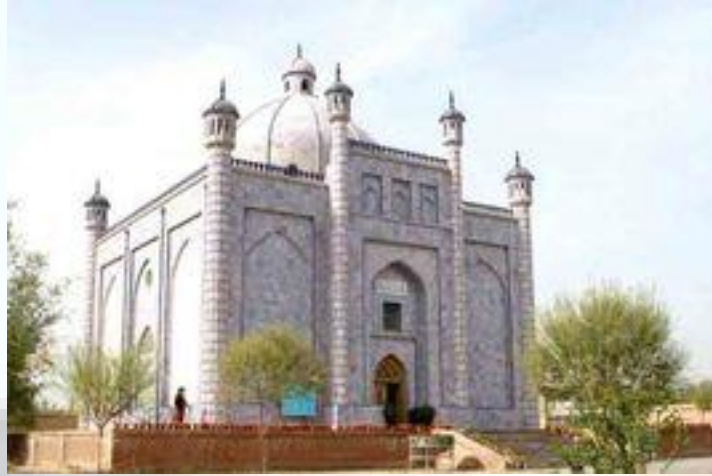
Sultan Satuq Bughra Khan Maziri (Atushta)

Kökmenzil (chingXey) giche kengeytkendin keyin miladi 958-yili Turpanda sheht bolghan.