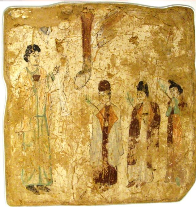
Turpanda Xristianizm (Nesturi)