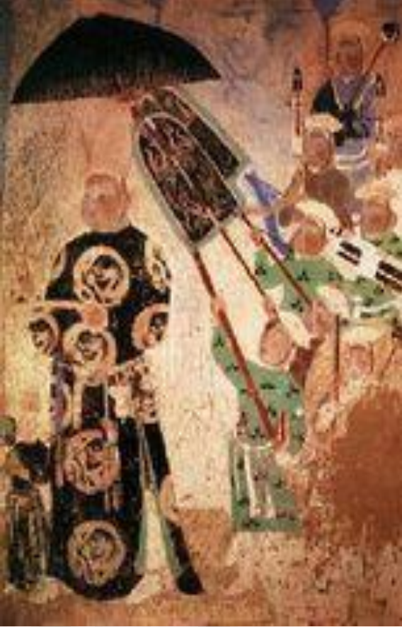
Trk Qaghanliqi dewridiki Buddizm

Uyghurlar Urxun wadisida qurulghan Trk Qaghanliqi (Trkstan) dewri (miladi 700-yillar) din kyinki din -tiqatlrini ispatlaydighan tarixiy resimler twendikiche: